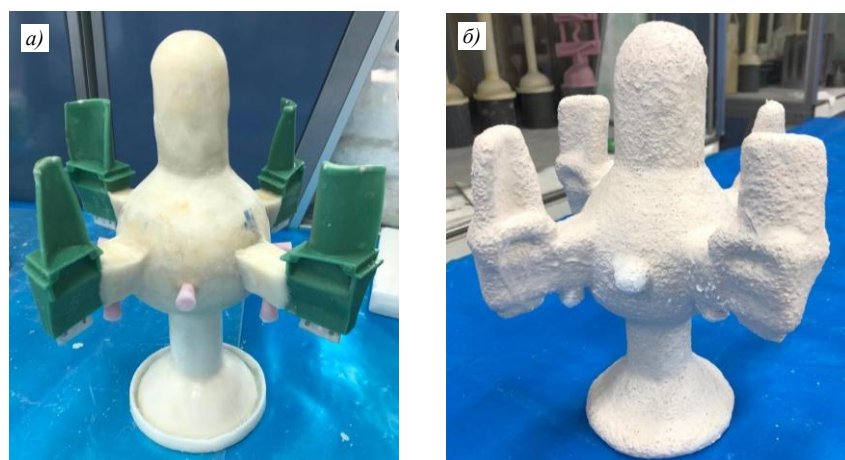
Рис. 4. Общий вид модельного блока (а) и керамической формы (б)