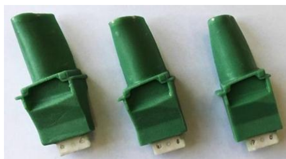
Рис. 3. Общий вид восковых моделей с керамическими стержнями из плавленного кварца