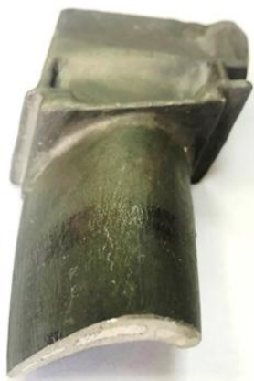
Рис. 5. Общий вид отливки лопатки с керамическим стержнем из плавленного кварца

Произведены заливка керамических форм и отрезка отливок лопаток с последующей их пескоструйной очисткой (рис. 5). По результатам визуального контроля отливок лопаток турбин выявлено, что керамические стержни на основе плавленного кварца разработанного состава обеспечили получение отливок лопаток турбин без дефектов типа «поллом стержня» и «выход стержня».