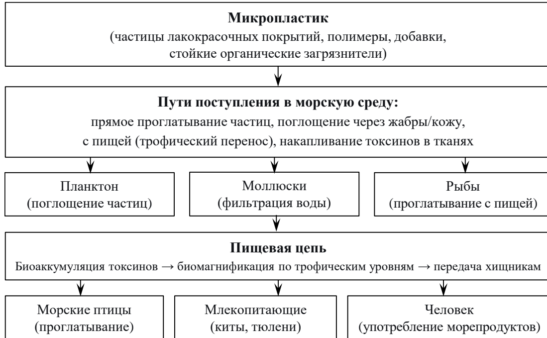
Рис. 1. Взаимодействие микропластика с живыми организмами

детально задокументированы механизмы прямого физического воздействия макропластика (фракция частиц размером >5 мм) на гидробионты, включая его заглатывание и запутывание в нем. Однако убедительных доказательств каскадного негативного воздействия макропластика на уровень популяций или целостных биоценозов в настоящее время недостаточно. Менее изученным остается вопрос о комплексном экотоксикологическом влиянии микропластика (фракция частиц размером <5 мм), что определяет его в качестве приоритетного объекта исследований.